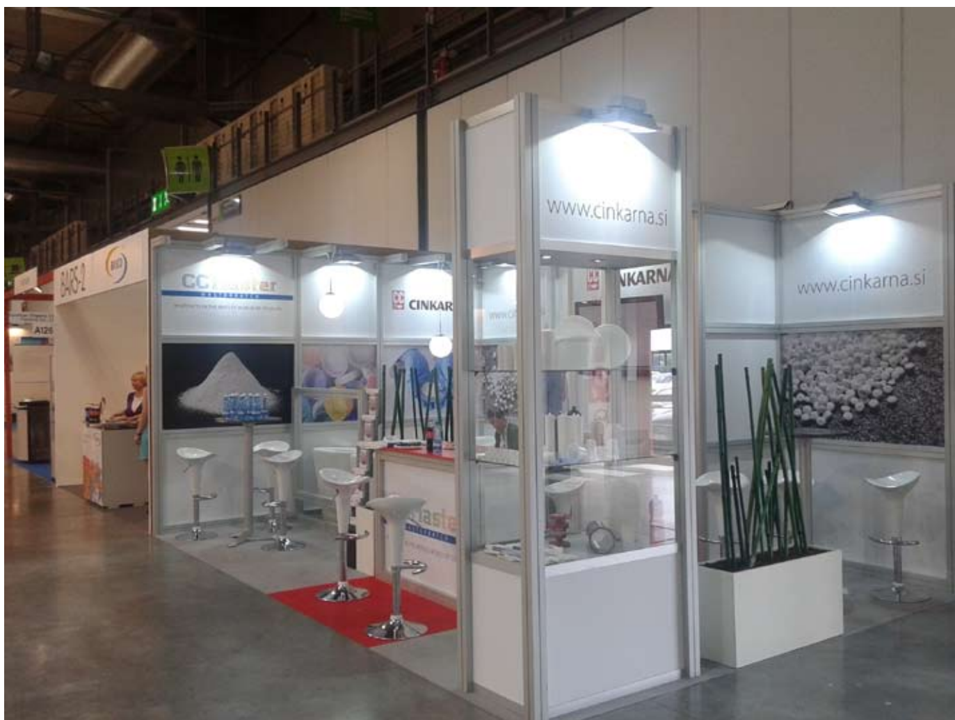
Letos Cinkarna ponovno na sejmu Plast Milano