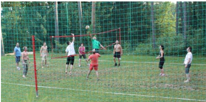
Kdo bo dosegel točko...