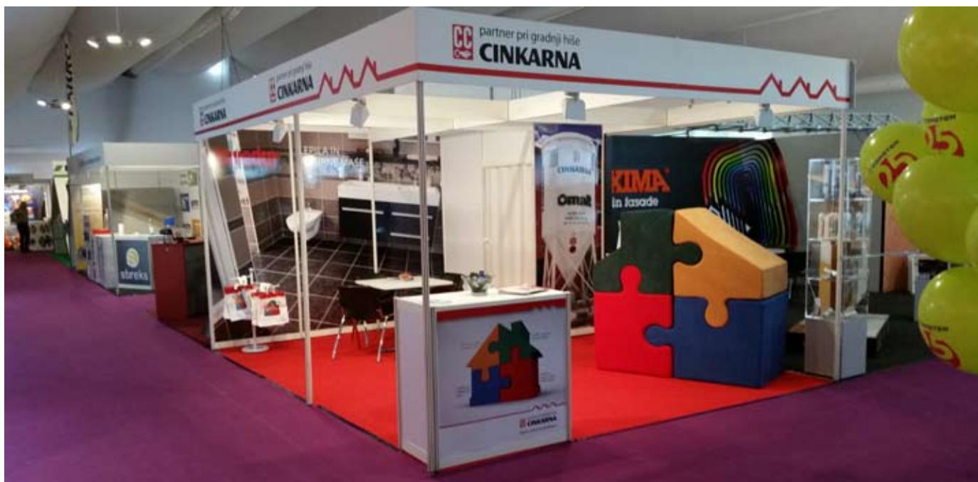
Cinkarna na sejmu Dom - največjem gradbenem sejmu v Sloveniji