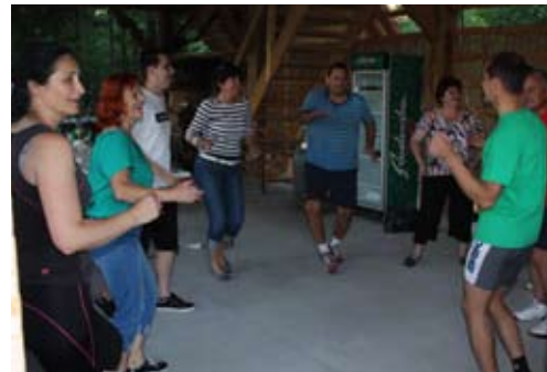
Razgibali smo se tudi ob ritmičnih glasbah...