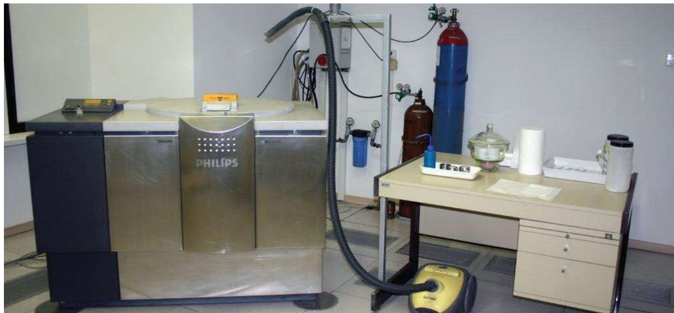
WDXRS v Službi kakovosti

V Cinkarni uporabljamo rentgensko fluorescenčno spektrometrijo od leta 1973. Glavno področje uporabe je določevanje elementov v procesnih vzorcih proizvodnje titanovega dioksida.