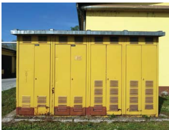
Stara TP Žica

Poleg boljše varnosti in funkcionalnosti ter zagotovitve večje zanesljivosti dobave električne energije, je nova TP Žica tudi estetsko dosti lepša kot prejšnja. To pa tudi ni zanemarljivo, saj se nahaja ob naši glavni cesti, ki vodi od vratarnice proti Marketingu in je zaradi tega na zelo vidnem mestu. Največ povedo seveda fotografije stanja prej in potem.