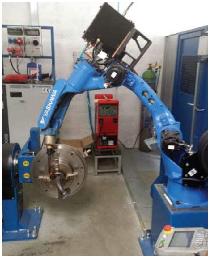
Industrijski varilni robot Motoman MA1440

V obstoječi delavnici za varjenje potekajo delovne operacije, kot so sestavljanje elementov, pritrjevanje sestavnih delov, varjenje sestavnih delov, kontrola elementov, brušenje elementov in zlaganje le-teh na transportno paletu. Poleg drugih obratov v PE Polimeri, se pri nas največ ukvarjamo z izdelavo elementov za pretok agresivnih medijev. V to skupino izdelkov spadajo cevovodi, ventili in drugi cevni elementi, ki so znotraj zaščiteni z oblogo iz fluoriranih polimerov (PTFE, PFA, FEP). Izdelujemo tako standardne (85%), kot tudi unikatne (15%) elemente, ki so narejeni za specifične potrebe naših kupcev. Nosilni element vseh naštetih elementov cevovoda je jeklo. Kadar ocenjujemo količino vložnega dela v izdelavo