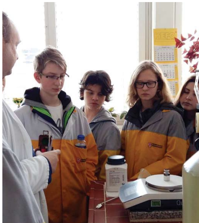
Prikaz dela v laboratoriju