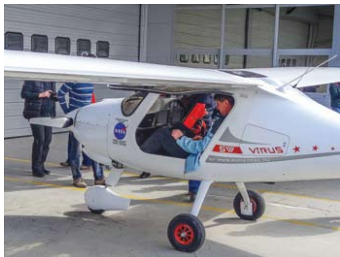
Pri proizvajalcu ultralahkih letak v podjetju Pipistrel