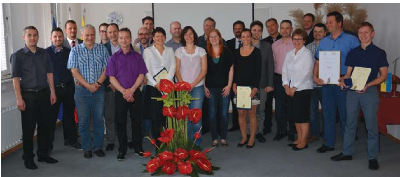
Ob podelitvi priznanj