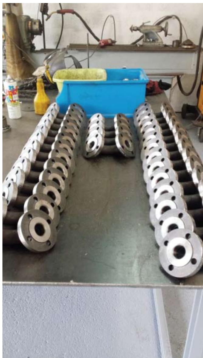
Izgled elementov po zaključeni operaciji varjenja