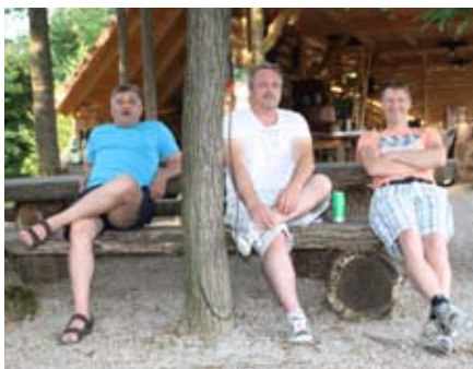
Tudi navijačem ni težko...