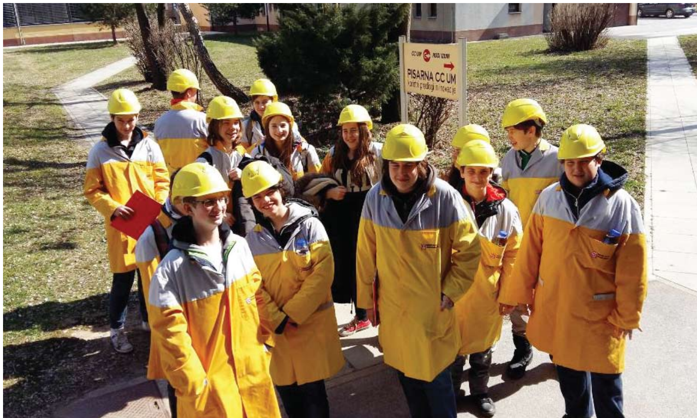
Za konec še ena skupinska