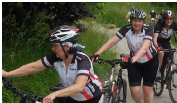
AJM 2014 - Kdo je to cesto v hrib prislonil