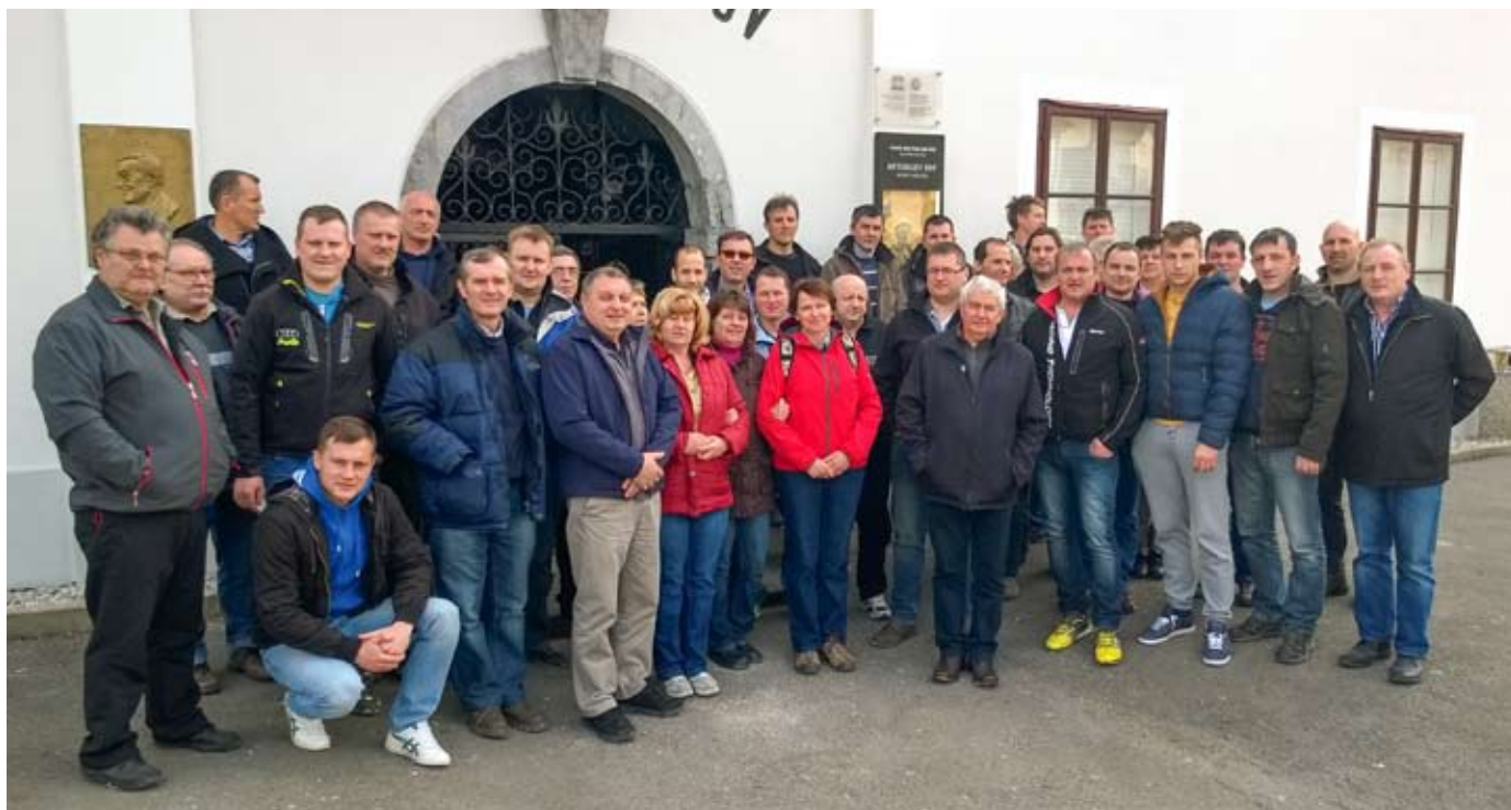
Inovatorji so si ogledali Antonijev rov, nekdanj rudnik živega srebra