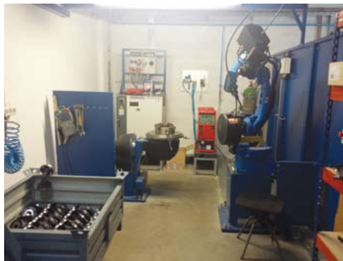
Varilna celica z varilnim robotom in ostalo opremo

Glavni cilji, ki jih želimo doseči z vpeljavo industrijskega robota v naš proces so: zmanjšanje vložnega dela, povečanje fleksibilnosti in kvalitete izdelka, povečanje zanesljivosti