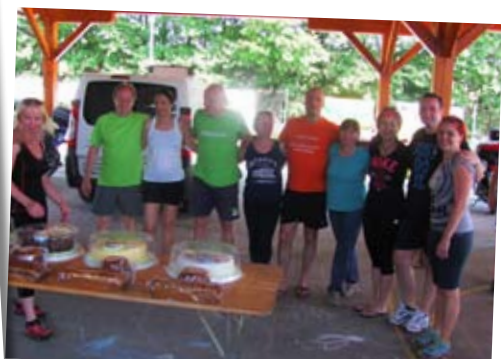
Tradicionalno športno srečanje cinkarnarjev, Lopata 2015