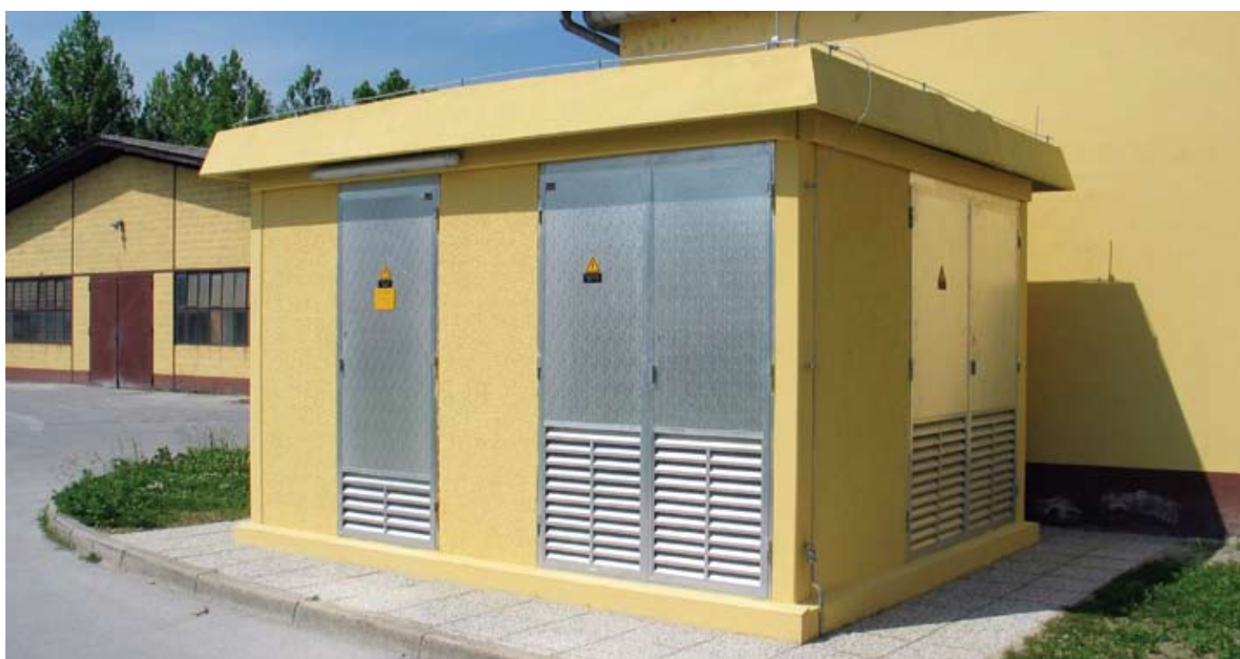
Nova TP Žica