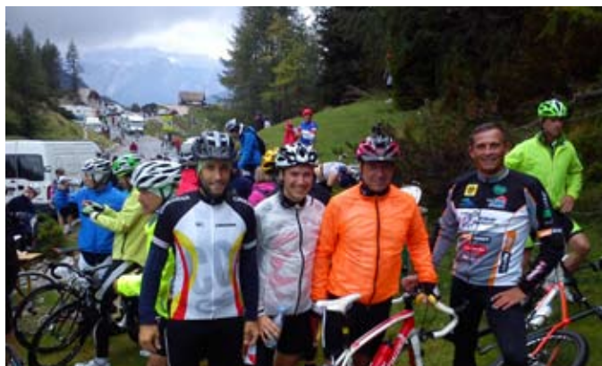
Na cilju 36. Juriša na Vršič

Tako kot kolesarstvo postaja vse bolj razširjena oblika rekreacije, smo tudi člani kolesarske sekcije »Gamsi – CC« v preteklem letu pridobili nekaj novih članov željnih rekreacije na kolesu.