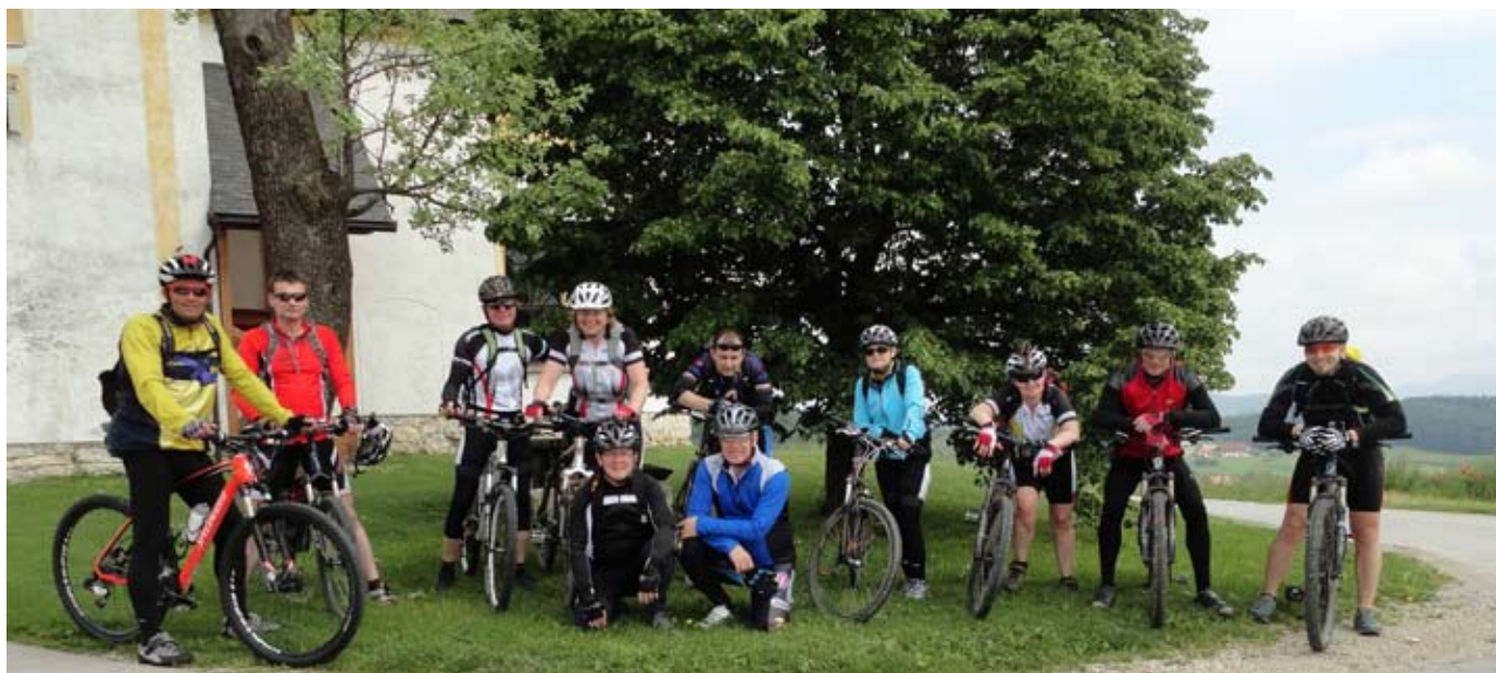
Na poti na Kozjansko