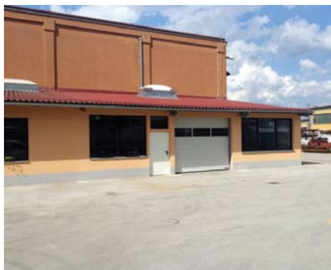
Stara varilnica in odstranjene garaže. Na razpolago je celoten prostor, dolžina 23 m in širina 6.80 m

Zato smo se odločili za investicijo varilne celice. Celica je opremljena z industrijskim varilnim robotom Motoman MA1440 z robotskim krmilnikom DX200. Robotska celica ima eno delovno mesto, ki je opremljeno z zasučno nagibnim pozicionerjem DK 250. Robot je opremljen z vodno hlajenim pulznim varilnim izvorom in z ustreznim mehanskim vodno hlajenim gorilnikom. V celici se nahaja tudi mehanski čistilec gorilnika s škarjami. Varilna celica omogoča varjenje izdelkov, ki dimenzijsko ne presegajo omejitev delovnega valja in nosilnosti pozicionerja, ki znaša 250 kg. Premer delovnega valja znaša 1200 mm, njegova višina pa je 1000 mm [3] [4].