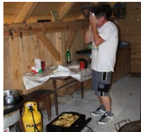
Vroče, a vse za zadovoljne sodelavce...